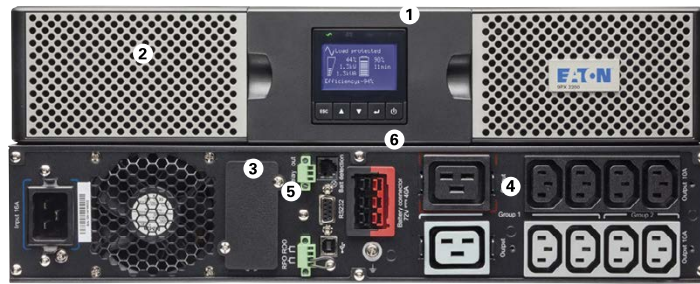
Eaton 9PX 3000 VA

3 Слот для карты сетевого управления (сетевая карта является стандартной в версии netpack).