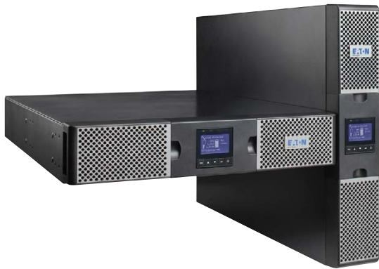
3000 Вт в корпусе высотой 2U!