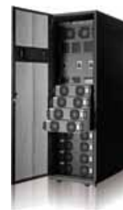
Масштабируемость и горячая замена