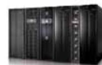
Эстетичный современный дизайн ИБП Modulon DPH выполнен в стиле InfraSuite – инфраструктурных решений для ЦОД от Delta

* Работа в диапазоне напряжения 140/242~176/305 В пер. тока при нагрузке ИБП 60 ~ 100 %.