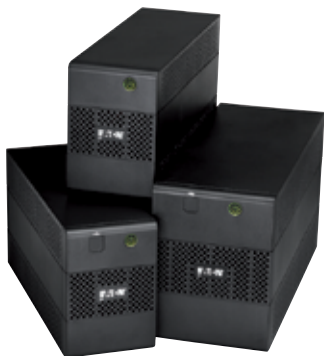
ИБП серии 5E